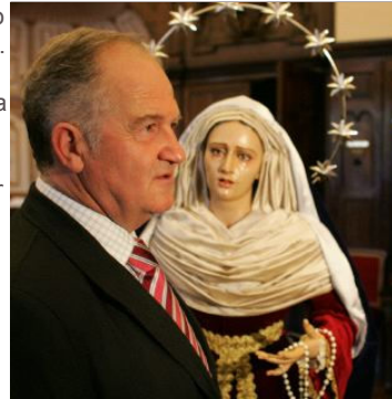
Estreno. El autor posa junto a la Virgen de Ramos.

Tallar es su vida. Este imaginero sevillano lo supo desde que vivió por primera vez la Semana Santa. Las imágenes de los pasos le parecían entonces «demasiado serias». Ahora, a sus 55 años, lleva a sus espaldas un sinfín de obras que le han coronado como uno de los artistas más importantes de España. La última se bendijo ayer en la Parroquia de San Vicente de Bilbao. Con «orgullo» presentó la Virgen de Ramos y del Rosario, la última novedad de la Semana Santa.